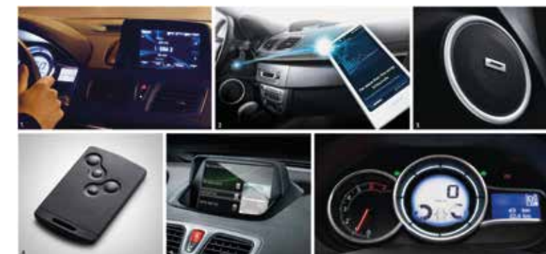
1. PANTALLA TACTIL DE 7" MULTIMEDIA • 2. BLUETOOTHS & HANDS FREE AUDIO STREAMING 3. SISTEMA DE AUDIO BOSE • 4. TARJETA MANOS LIBRES • 5. CAMARA DE VISION TRASERA